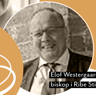
Elof Westergaard, biskop i Ribe Stift