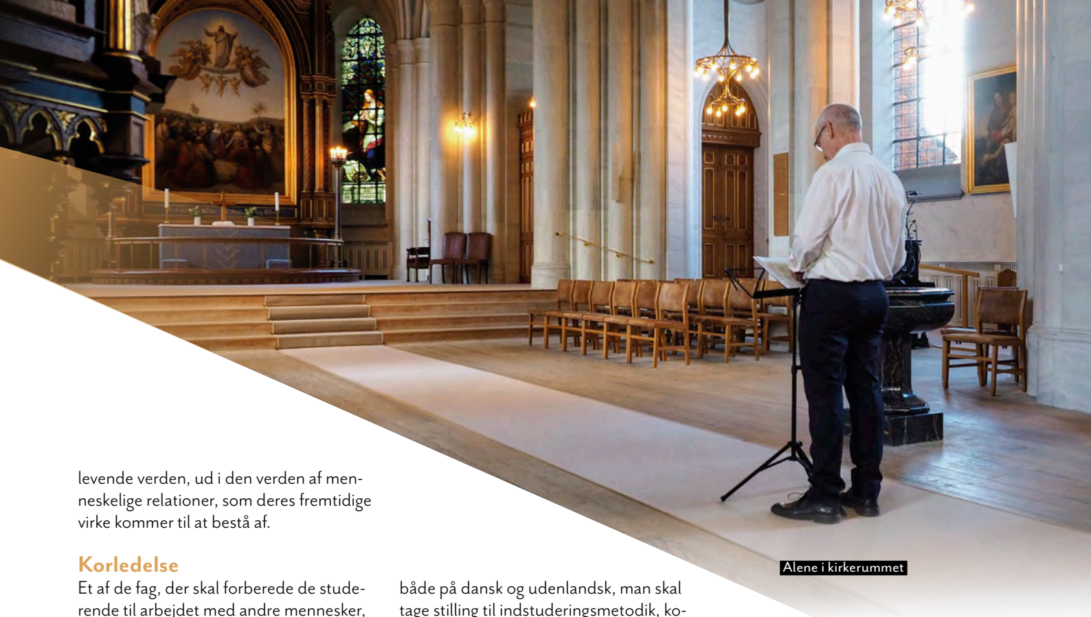
Alene i kirkerummet

levende verden, ud i den verden af menneskelige relationer, som deres fremtidige virke kommer til at bestå af.