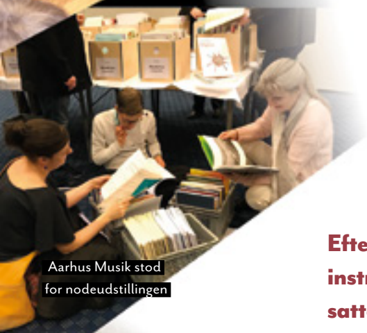
Aarhus Musik stod for nodeudstillingen