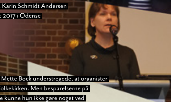
Kirkeminister Mette Bock understregede, at organister er vigtige for Folkekirken. Men besparelserne på uddannelserne kunne hun ikke gøre noget ved