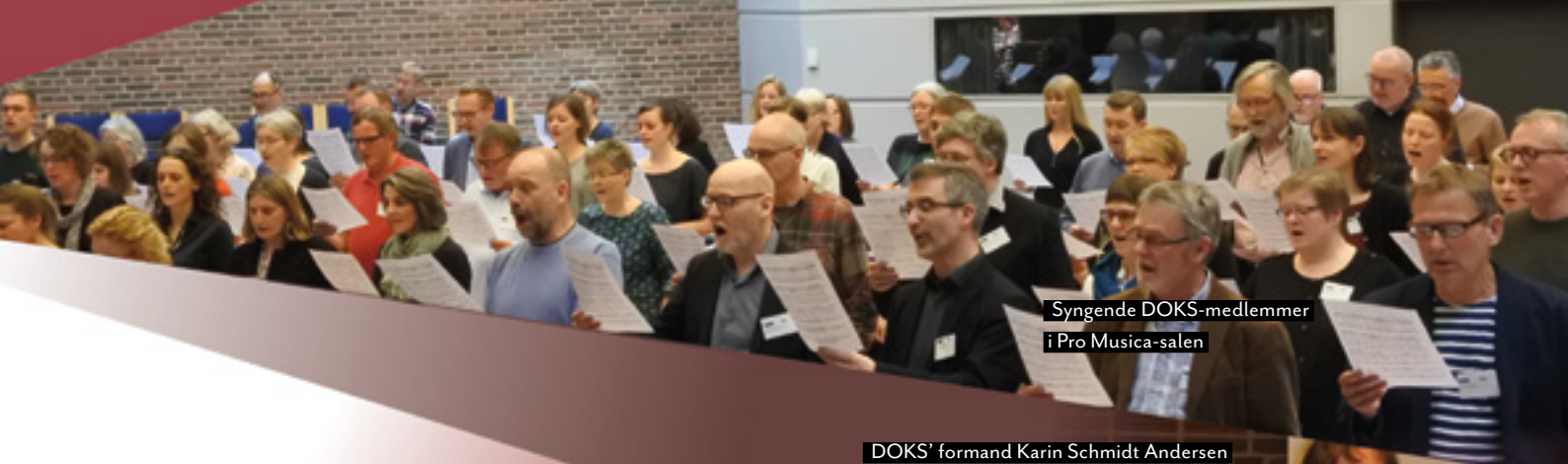
Syngende DOKS-medlemmer i Pro Musica-salen