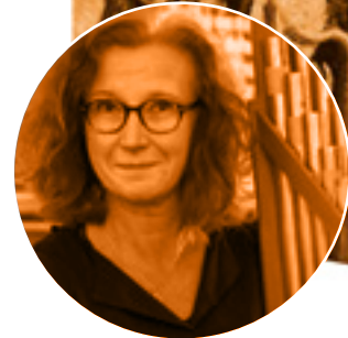
Mie Korp Sloth, Levende Musik i Skolen