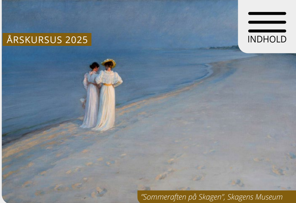
"Sommeraften på Skagen", Skagens Museum