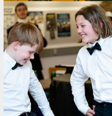
Fællesskabet i koret er også en vigtig del af at være kordreg.