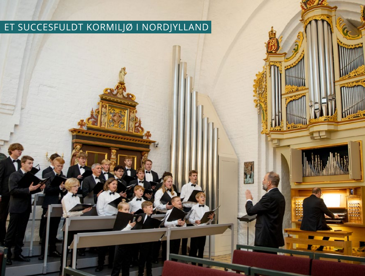
Koret synger til alle gudstjenester plus fire gudstjenester - eller 'evensongs' - årligt.