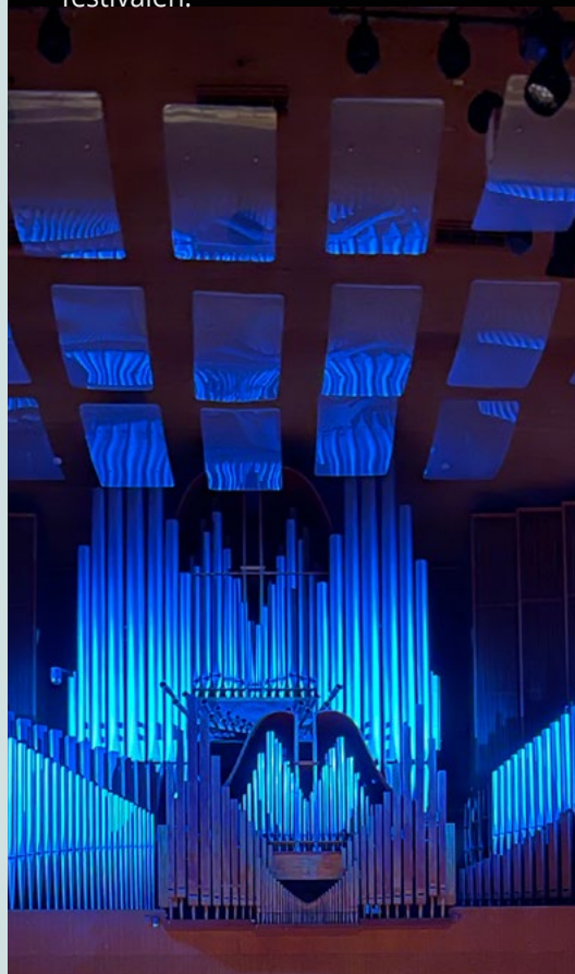
DKDM's koncertsal i København er et af koncertstederne i Copenhagen International Organ Festival 2025.

Improvisationskunst og ukendte komponister bliver en vigtig del af festivalens program, hvor der også er internationalt besøg: Inger-Lise Ulsrud fra Oslo og Professor David Franke fra Freiburg gæster begge festivalen.